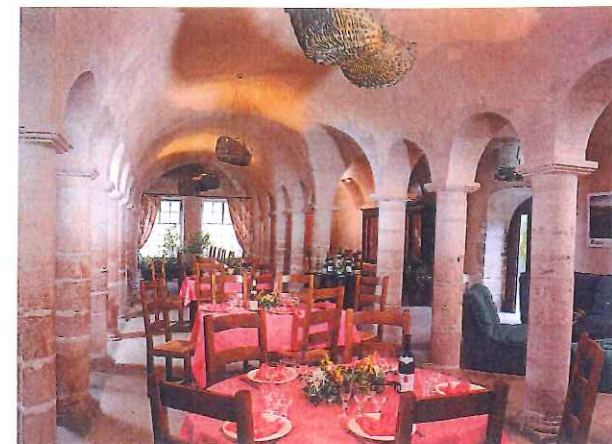
Salle à Colonnes et cour extérieure