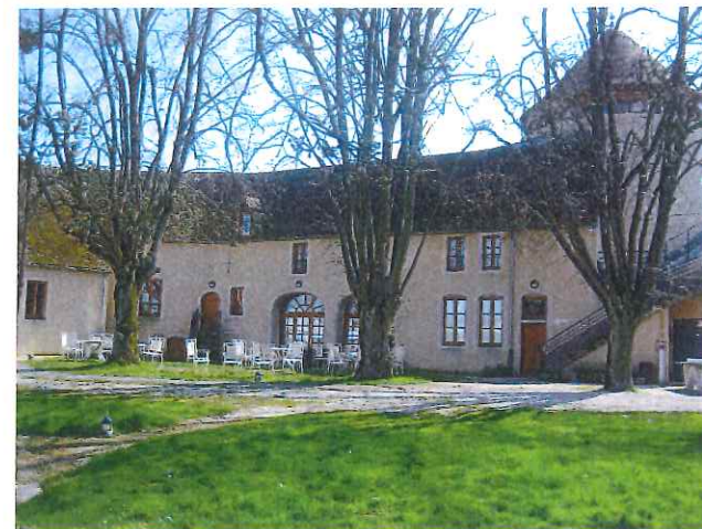
Cour extérieure Grand et Petit Château